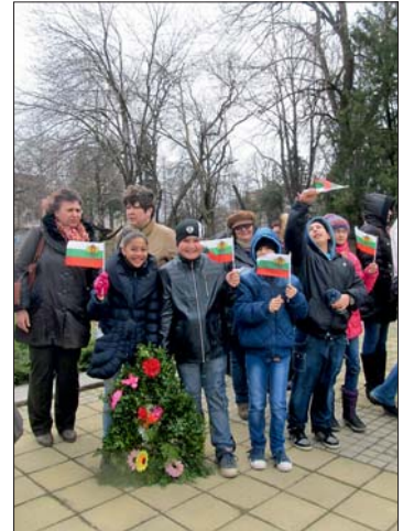
ставители на различни партии и организации.

С едноминутно мълчание в знак на почит и поклон пред всички български герои и пред загиналите 220 лясковски борци, чиито имена са изписани на паметника в центъра на Лясковец, всички дошли на поклонението, изразиха своята признателност към падналите в борбата за независимостта на България. Венци и цветя бяха положени от името на община Лясковец и общинския съвет, от съюза на ветераните и сержантите от запаса и резерва, от учениците от училищата и настоятелствата на детските градини, читалището, пенсионерските клубове, от пред-