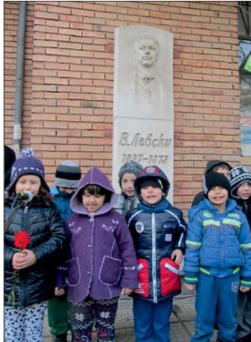
барелефа лясковчани сведоха чела и положиха цветя и венци.

В знак на признателност към героичната саможертва на Левски, събралите се пред