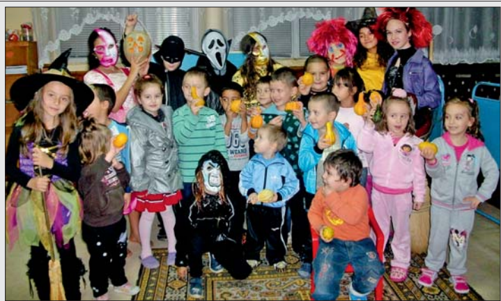
Децата на Драгижево плашиха лошите духове в навечерието на Хелоуин.

Нека с общи усилия, спазвайки основните противопожарни правила и норми, да намалим рисковете за нас и имуществото ни.